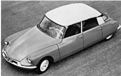
Die "Deesse" wurde 1955 vorgestellt

Ich glaube, daß das Auto heute das genaue Äquivalent der großen gotischen Kathedralen ist. Ich meine damit: eine große Schöpfung der Epoche, die mit Leidenschaft von unbekanntem Künstlern erdacht wurde und die in ihrem Bild, wenn nicht überhaupt im Gebrauch von einem ganzen Volk benutzt wird, das sich in ihr ein magisches Objekt zurüstet und aneignet.